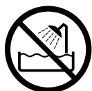
水場での使用禁止